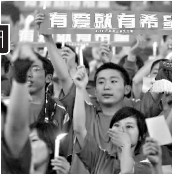
5月18日，河南鹤壁点蜡悼念汶川地震遇难者祈福。

5月19日，14时28分，北京长安街上，人流车流骤然停止。3分钟内，汽车、火车、舰船的汽笛和防空警报在全国同时鸣响，哀痛之声响彻中华大地。