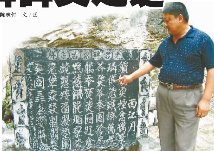
老君古字碑碑文奇特怪异。

鹤山区五岩山上有 一通石碑近年来日益受 到人们的关注。除了一些 研究人员外,认识该碑碑 文的人为数极少,能够理 解其意的人更是凤毛麟 角。