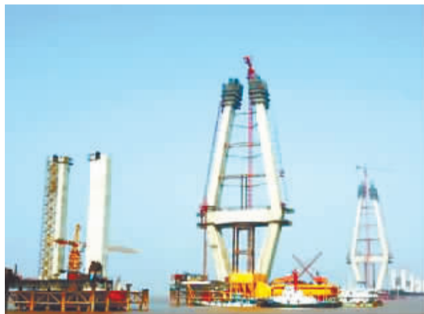
金义集团的海盐乳化油制造基地