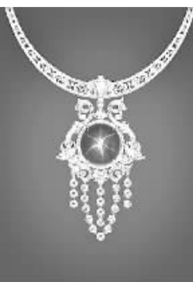
“亚太之星”天然红宝石项链

一般意义上,比较适合做投资用途的奢侈品有手表、名酒和名牌珠宝。选择投资型手表时需要注意,大品牌的表一般都有该品牌的标记,这些标记都非常清晰,有的还会刻上工匠的名字,这都是名贵表的重要标记。另外,还要查阅该品牌的相关资料,确认其价值,核实产地等等。