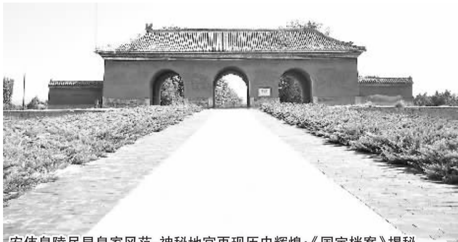
宏伟皇陵尽显皇家风范,神秘地宫再现历史辉煌;《国宝档案》揭秘

明十三陵工程浩大,见证了当时皇室贵族的显赫地位。以发掘开放的定陵为例,它是明朝第十三位皇帝万历皇帝朱翊钧的陵墓,他跟两位皇后一起合葬在这里。万历皇帝10岁即位,在位48年,是明朝在位时间最长的皇帝。定陵在万历皇帝生前就开始修葺建造,历时6年才完成,耗资白银800万两。陵墓建成后,万历皇帝年仅28岁,直到1620年万历皇帝逝世,定陵才正式启用,陵墓闲置达30年之久。而上世纪50年代对定陵地宫的发掘则令后人感受着一代皇帝的传奇故事。上世纪50年代中期,当时的北京市副市长吴晗提出了考古发掘明十三陵的计划,这也是中国历史上第一份发掘古代皇陵的计划。最初的计划是发掘明成祖朱棣的长陵,但是由于对长陵的调查一开始就陷入了困境,找不到一点线索,于是将目标转为万历皇帝朱翊钧的定陵。1956年5月,发掘定陵地宫的计划正式实施。因为发掘