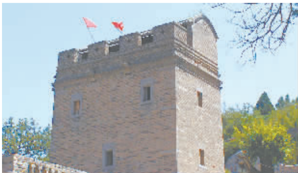
经历了风风雨雨仍巍然屹立的餐霞阁