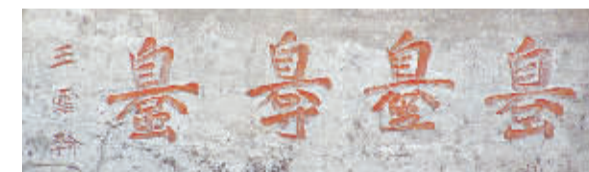
王云翰书的摩崖石刻