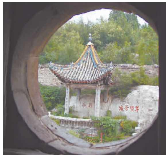
从餐霞阁顶层的圆形窗口望去，对面来鹤亭如镶在画框里的画