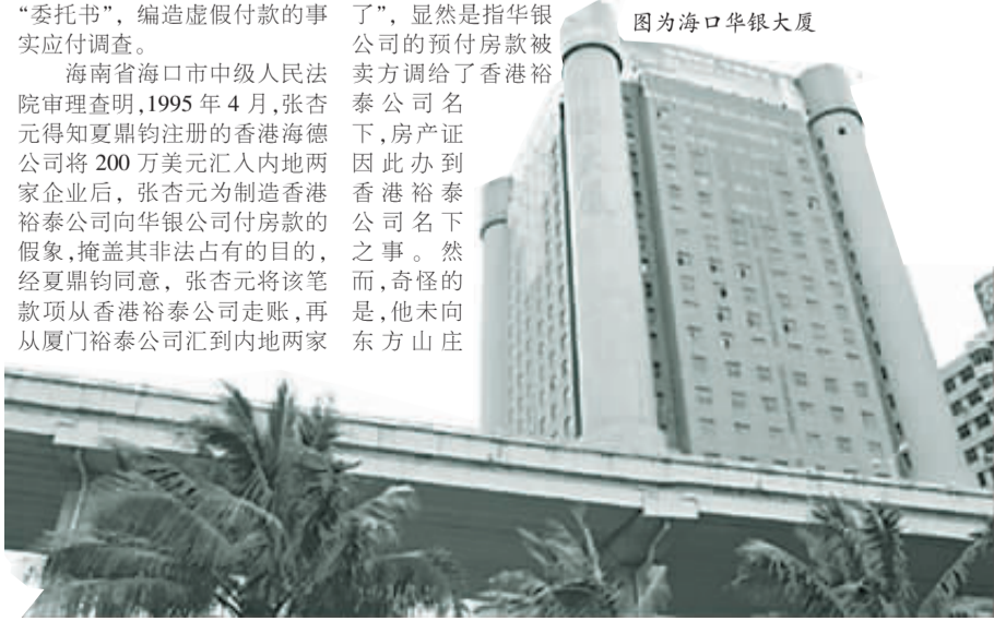
图为海口华银大厦