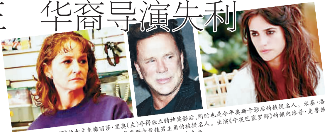
《冰冻之河》的女主角梅丽莎·里奥(左)夺得独立精神奖影后，同时也是今年奥斯卡影后的被提名人。米基·洛克(中)获得了最佳男主角奖，也是今年奥斯卡最佳男主角的被提名人。出演《午夜巴塞罗那》的佩内洛普·克鲁兹(右)获得了最佳女配角奖，她也是今年奥斯卡最佳女配角的竞争者。

“独立精神奖”创立于1984年，专门用来表彰除美国各大影业巨头以外独立制片的优秀电影作品。23日，全球瞩目的第81届奥斯卡金像奖在好莱坞揭晓，按照惯例，独立精神奖提前一天举行颁奖典礼。