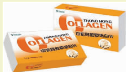
美国进口天然骨关节产品

乳香对舒筋展骨、活血通络的功效为历代医家所推崇,它能追风、定痛、化痰、排毒。古代供奉圣者的乳香,延续千万治病救人的神话,终于在现代以高科技提纯出它的主要有效成分——乳树脂酸。乳树脂酸的活血、抗菌、消炎、止痛等功能有利于保护软组织。