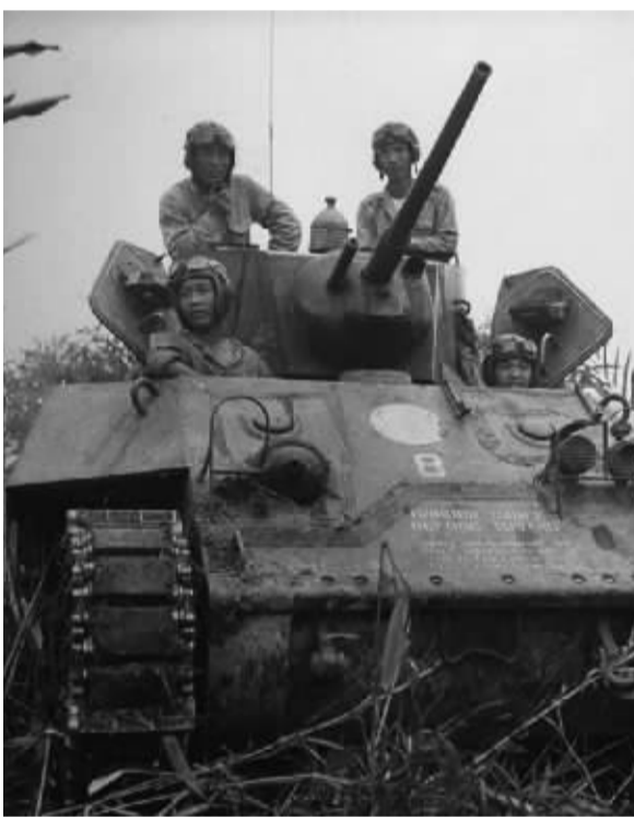
中国远征军装备的美式装甲战车。

康河谷内的达罗至太白加一线,中国军队兵分两路向南进击。左路为孙立人指挥的新编第38师,右路为廖耀湘指挥的新编第22师。1月中旬,左路38师夺占日军各外围阵地,右路22师渡过塔奈河,进至达罗北面附近的百贼河。1月28日拂晓,从太平洋起飞的美军飞机开始对日军阵地实施猛烈轰炸,迫使日军突围后撤。2月1日,新编38师占领太白加,使中国驻印军在缅甸境内站稳了脚跟,开辟了向纵深地区进攻的道路。