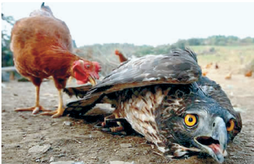
被凶悍母鸡吓坏了的鹰