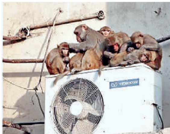
跳到空调机上的猴子