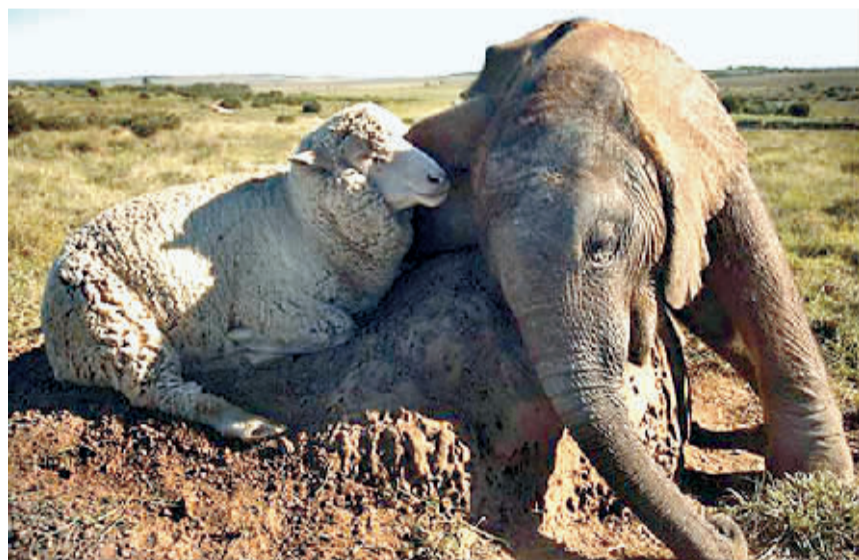
小象温柔“靠”在羊“妈妈”身边