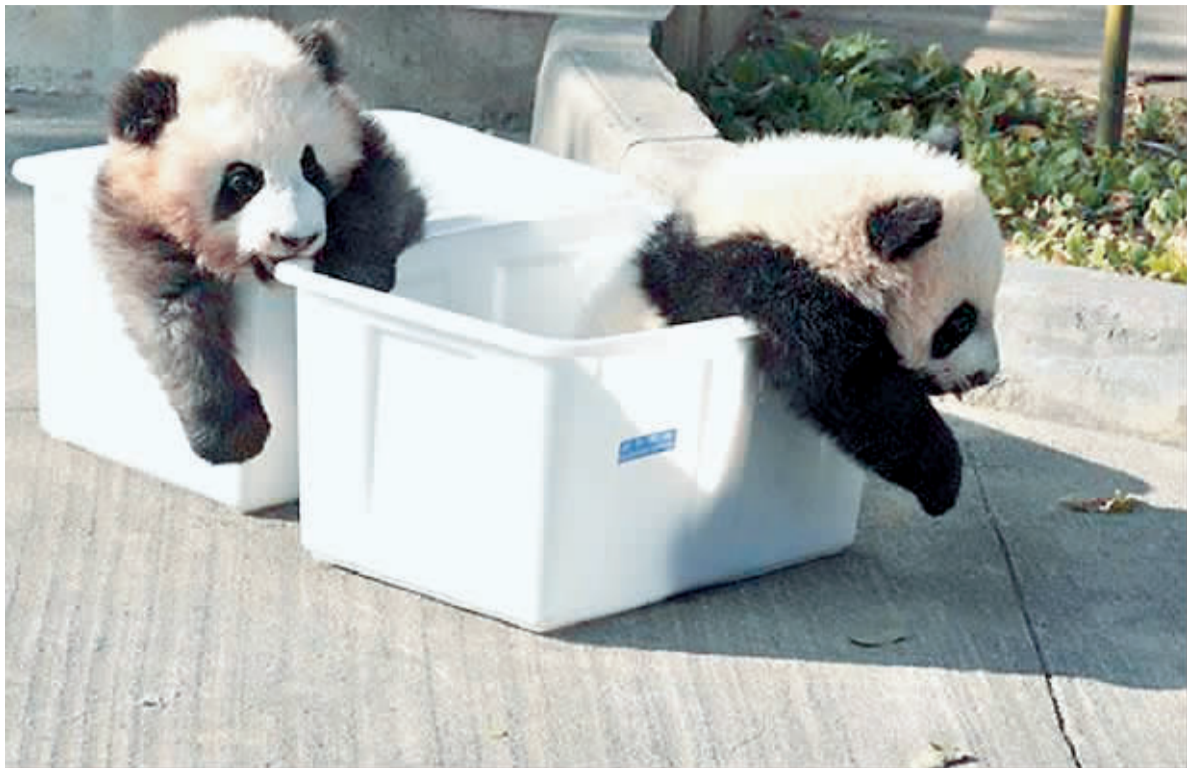
两只可爱的小熊猫