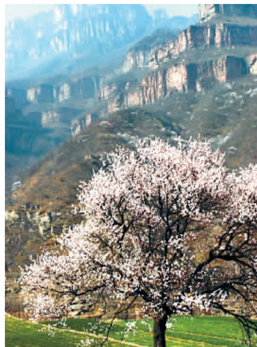
太行大峡谷的春天