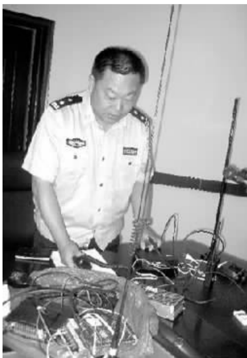
警方展示作弊器材