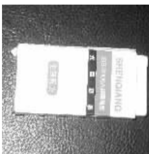
橡皮其实是“接收器”