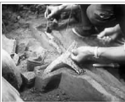
左图:一副兵器戈被发现的照片令秦俑主人归属再次成谜。

对于这一观点,袁仲一认为,铁兵器代替青铜兵器是一个过程,因为冶炼技术的普及需要一定的时间。所以从目前的考古资料来看,秦代出土的兵器基本上是青铜兵器,