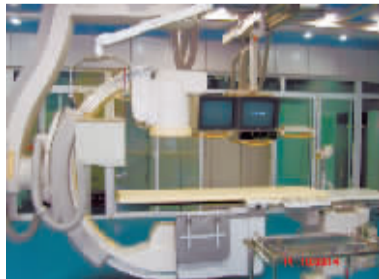
进口荷兰皇家飞利浦1250毫安数字X线血管造影系统

1.5T带频谱核磁共振检查优势: 是目前豫北地区最先进、鹤壁市境内唯一的大型设备,磁场强度高,大大缩短病人检查时间;组织分辨率高,成像清晰;具有波谱分析功能,有助于恶性肿瘤的早期诊断,低磁场磁共振不具有此功能。