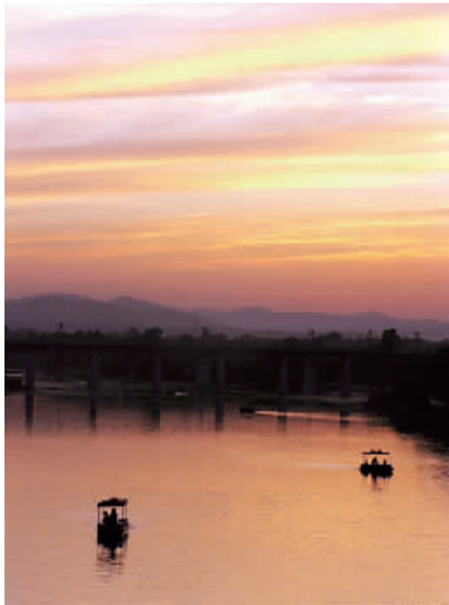
晚霞 镜趣 摄