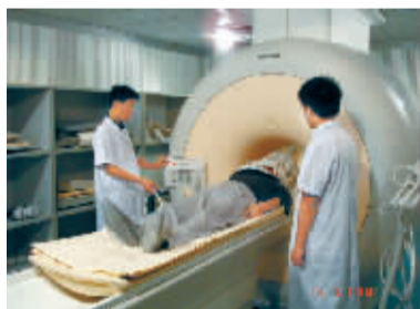
进口荷兰皇家飞利浦1.5T带频谱核磁共振系统

1.5T带频谱核磁共振检查优势: 是目前豫北地区最先进、鹤壁市境内唯一的大型设备,磁场强度高,大大缩短病人检查时间;组织分辨率高,成像清晰;具有波谱分析功能,有助于恶性肿瘤的早期诊断,低磁场磁共振不具有此功能。