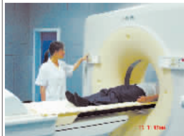
进口荷兰皇家飞利浦16排螺旋CT

SPECT检查优势: 是目前河南省最先进、鹤壁市境内唯一的SPECT设备,可以明确诊断冠心病、心肌梗塞、心肌缺血、骨肿瘤、骨转移瘤、股骨头坏死、甲状腺瘤、甲亢和多种肾脏疾病,具有发现病灶早、特异性强、安全可靠的优点。