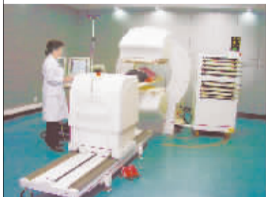
飞利浦可变量双探头SPECT

SPECT检查优势: 是目前河南省最先进、鹤壁市境内唯一的SPECT设备,可以明确诊断冠心病、心肌梗塞、心肌缺血、骨肿瘤、骨转移瘤、股骨头坏死、甲状腺瘤、甲亢和多种肾脏疾病,具有发现病灶早、特异性强、安全可靠的优点。