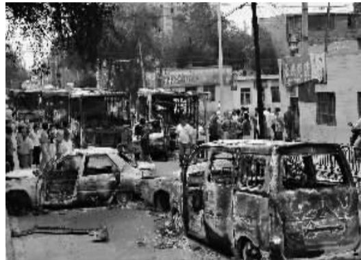
7月6日,乌鲁木齐市北湾街上停放着多辆被烧毁的汽车。