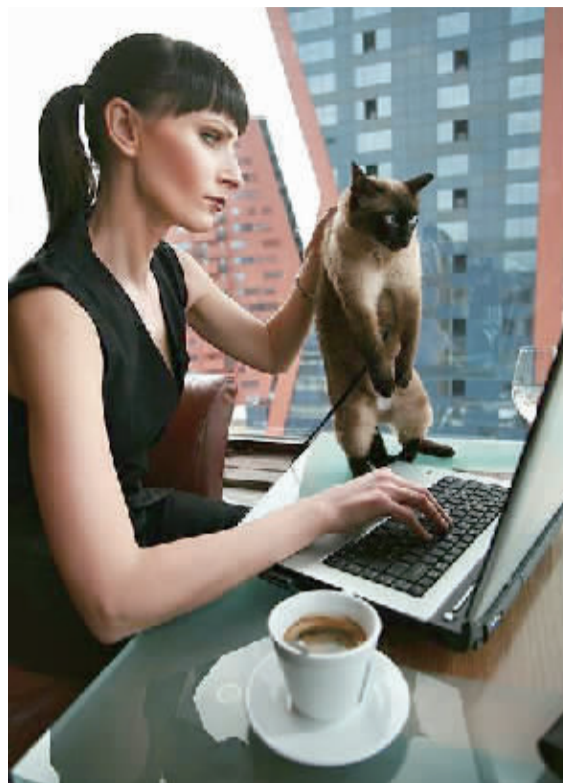
没有鼠标,用猫标试试