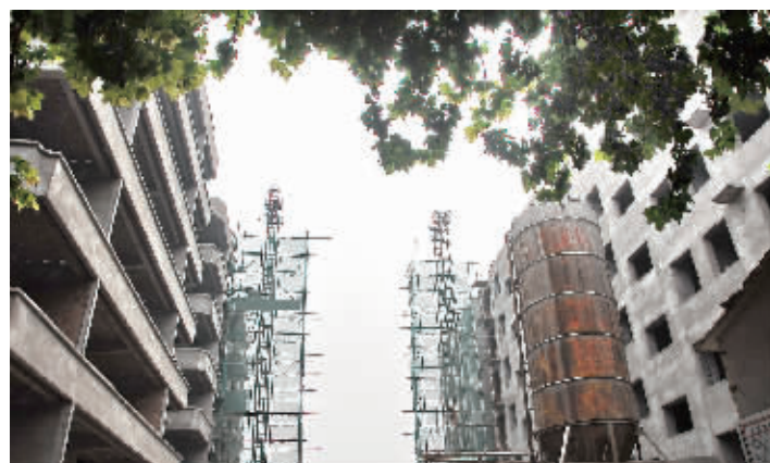
正在建设中的山城区阳光佳苑

《鹤壁日报》的报道里有句话:“加快老区发展步伐,使老区人民共享改革发展成果,这是去年在人代会上我们对老区人民的庄严承诺。”我觉得这话说得很好很诚恳,真正做到了心系人民。从这句话中既能看到市委市政府对老区的关心,又能看到市委市政府“新老区共生共荣”指导思想的明确。我想每个老区市民都会积极拥护市委市政府的这一举措。照这样的思路干下去,鹤壁的综合经济实力必然会越来越强,城市化步伐也必定会越来越快,我期待着这一天!