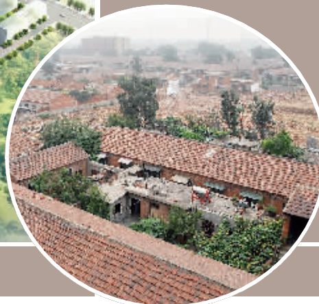
正在拆迁的棚户区