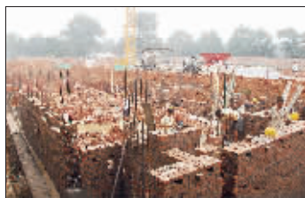
正在建设中的山城区枫岭苑小区

根。小区没有改造前,我和老伴儿住平房,阴暗潮湿。去年6月,我们小区作为全市第一个棚户区开始进行改造,大家高兴极了。拆迁前,邻居们心里都没底儿,推荐我代表大家给拆迁办写了封公开信,希望拆迁办真正将棚户区改造当成民心工程、优质工程来做。当我们把公开信送到拆迁办时,山城区长风办事处的领导当面向我们保证,一定会把好事办好。